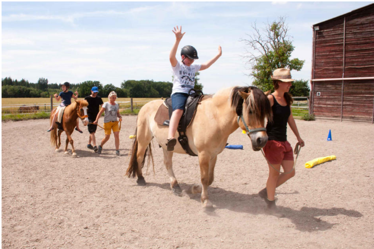
„Hoch die Hände, Wochenende“

Besonders überrascht waren wir von der großen Anzahl von Besuchern und deren Unterstützung für unseren Verein. Dafür möchten wir uns herzlichst bedanken!